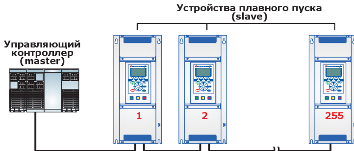
Рисунок 1 - Пример построения сети RS-485

На рисунке 1 приведен пример объединения в сеть нескольких УПП и внешнего управляющего контроллера. Каждый УПП имеет свой уникальный сетевой адрес от 1 до 255. Управляющий компьютер является ведущим (master), а УПП - ведомыми (slave) устройствами.